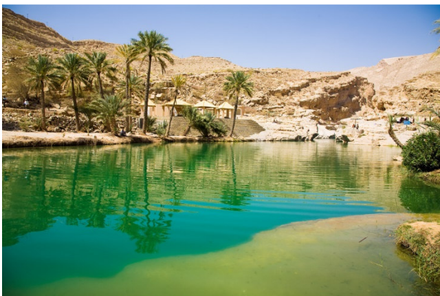
Wadi Bani Khalid