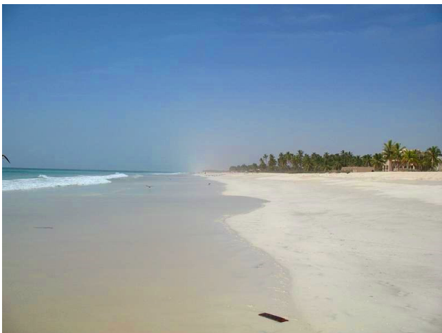
Salalah Strand