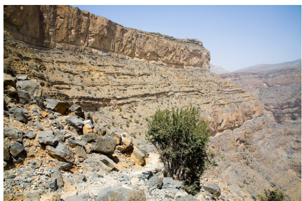
Jebel Shams