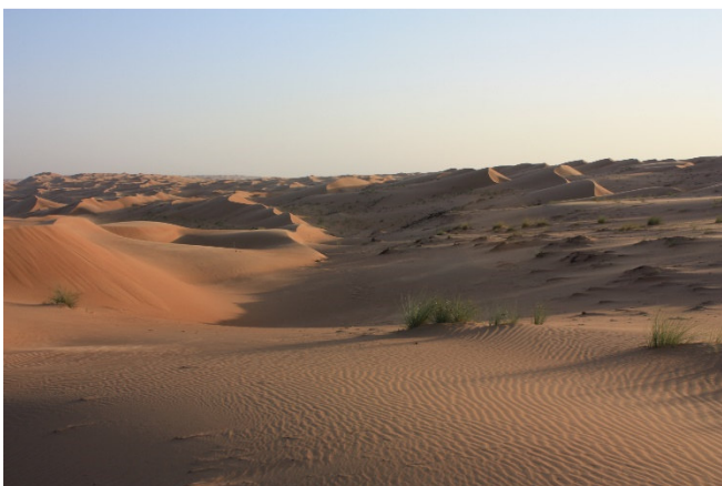
Wahiba Sands

Weiterfahrt zum Wadi Bani Khalid, welches zu den schönsten und grünsten Wadis im Oman gehört. Die Straße führt durch Berge und bietet einen schönen Ausblick auf die Umgebung. Im Schatten der Palmen reift eine Vielzahl von tropischen Früchten. Das letzte Stück führt direkt durch das Flussbett an dicken, glatt gewaschenen Felsbrocken und an Falaj-Kanälen vorbei. Die Straße endet an einem Parkplatz. Hier haben Sie Gelegenheit zu einer kleinen Wanderung weiter bis zum Wadi. Das Wadi ist üppig grün bewachsen und in dem glasklaren, türkisgrün schimmernden Wasser tummeln sich zahlreiche kleine Fische. Mittagspause (Lunchpaket).