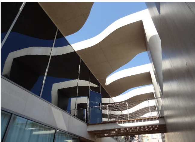
Musée Jean Cocteau

Nach etwa 1 h Fahrt erreichen Sie das malerische Städtchen Menton, den letzten französischen Ort vor der italienischen Grenze. Das spiegelt seine Altstadt wieder: Die pastellfarbenen Häuserfassaden vermitteln ein stark italienisches Flair!