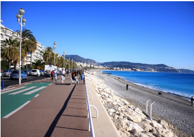
Promenade des Anglais