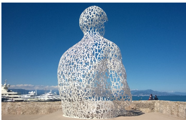
Skulptur von Jaume Plensa - Antibes

Weiter folgen Sie den Spuren der großen Künstler und kommen nach Antibes . Bei einer Stadtführung sehen Sie zunächst die moderne Kunst, die im öffentlichen Raum der Stadt Einzug gehalten hat: Die Skulpturen des spanischen Künstlers Jaume Plensa sehen Sie an mehreren Orten.