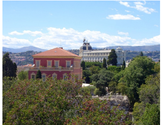
Cimiez CCBYSA CHRIS230***-at-flickr

Gemeinsames Abendessen im Restaurant in Èze. Anschließend Rückfahrt nach Nizza.