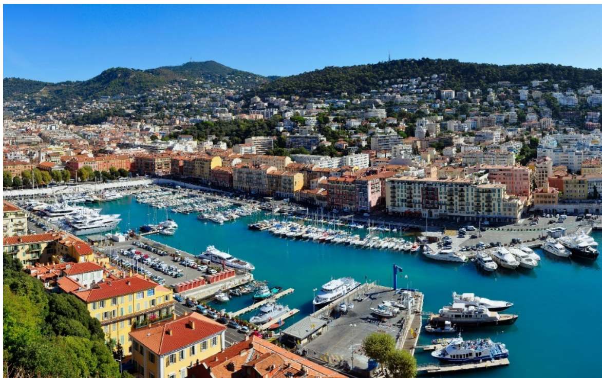
Hafen von Nizza

Genießen Sie die Region des Lichtes ! Sofort kann man nachvollziehen, dass Künstler und Schriftsteller diese facettenreiche Umgebung zur Inspiration und als Treffpunkt nutzten.