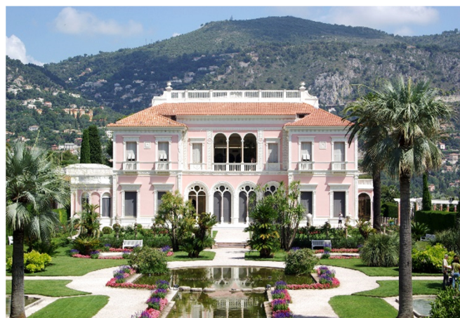
Villa Ephrussi de Rothschild

Die Villa im Stil der Neorenaissance wurde von 1905–1912 für die Baroness Béatrice de Rothschild erbaut. Das heutige Museum verdeutlicht die Liebe der Baronin zur Kunst der Belle Époque . Sie vermachte nach ihrem Tod sowohl die Villa als auch ihre gesammelten Kunstwerke der Académie des Beaux-Arts.