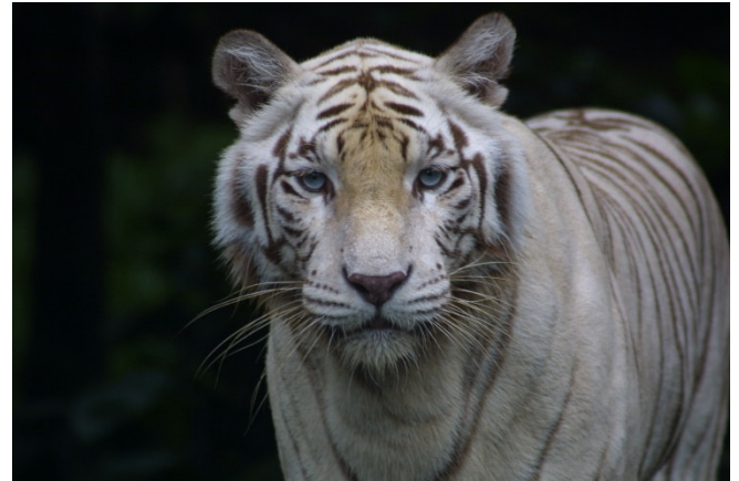
Singapore Zoo Weißer Tiger

Zeit zur freien Verfügung. Am Nachmittag Transfer zurück zum Hotel.