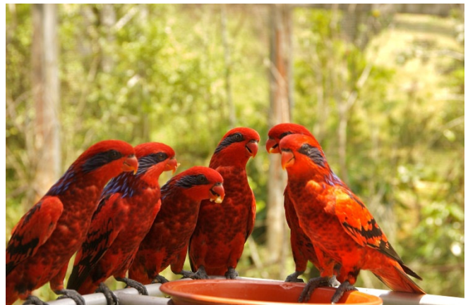
Jurong Bird Park