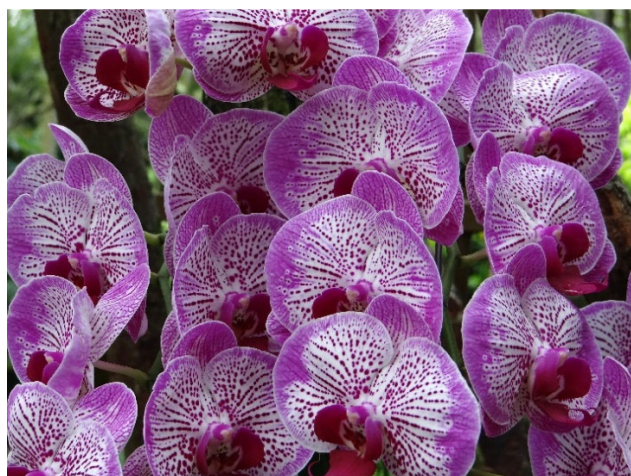
Singapore Botanical Garden

Der 82 ha große Garten zählt zum UNESCO-Weltkulturerbe und birgt innerhalb eines Urwaldbereiches bis zu 50 m hohen Baumriesen. Im Healing Garden sind Heilpflanzen nach ihrem medizinischen Nutzen gruppiert. Die pflanzliche Evolutionsgeschichte können Sie im Evolution Garden nachverfolgen. Höhepunkt des Gartens ist die größte Orchideensammlung der Welt mit über 1.000 Arten und 2.000 Hybridgattungen. Eine neue Erweiterung (ab 2018) ist der Learning Forest, der sich besonders der lokalen Pflanzenwelt widmet. Zeit zur freien Verfügung. Am Nachmittag Transfer zurück zum Hotel.