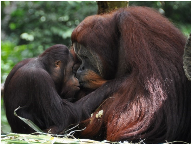
Singapore Zoo Orang Utan

Am Nordufer des Singapore River steht die Statue des Forschers Sir Stamford Raffles , der Singapur gründete und hier 1819 gelandet sein soll. Genießen Sie nun die Ansicht der Metropole vom Fluss aus. An Bord eines traditionellen „Bum boats“, die einst für den Transport zwischen Handelsschiffen und Lagerhäusern genutzt wurden, erwartet Sie eine malerische Bootsfahrt auf dem Singapore River. Dabei sehen Sie u. a. die 8,6 m hohe Merlion-Statue , das Wahrzeichen der Stadt.