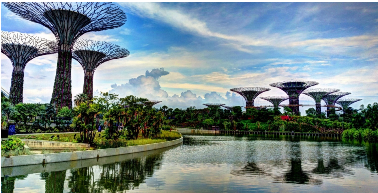
Singapur Gardens by the Bay

Reisetermin: 22./23.11. – 28./29.11.2019