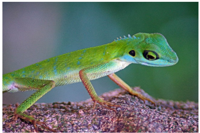
Sungei Buloh Wetland Reserve

Im Nordwesten Singapurs wurde das sensible Ökosystem eines Mangrovenwaldes durch Shrimp- und Fischzucht geschädigt. Um dem entgegenzuwirken entstand durch sorgsame Rekultivierung das Sungei Buloh Wetland Reserve , der erste ASEAN Heritage Park. Seit 2002 konnte sich in dem Naturpark wieder eine große Biodiversität bilden. Besucher können an Lagunen mit etwas Glück u. a. Warane und vielerlei Wasservögel entdecken. Informativ ist das neue Besucherzentrum.