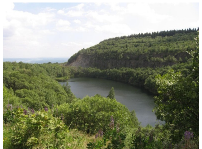
Meissner_ehem_tagebau CCBYSA3.0 Dirk Schmidt-at-Wikimedia Commons.

Am Hohen Meißner treffen sich jährlich die Angehörigen der Deutschen Waldjugend (DWJ) der SDW aus ganz Deutschland. Das kleine Mittelgebirge mit dem nur 10 km langen und max. 5 km breiten Höhenzug ist durch Wanderwege gut erschlossen; einige bieten interessante Aussichtspunkte.