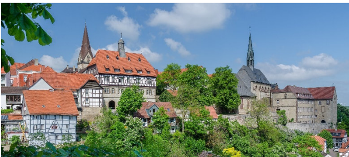
Warburg-Panorama-von-Fuegeler-Kanone CCBYSA3.0 Tuxyso-at-Wikimedia Commons

Nach einer individuellen Mittagspause fahren Sie weiter durch den vielgestaltigen, 200 km 2 großen Reinhardswald mit z. T. sehr altem Baumbestand. Sie erreichen das Heilbad Heiligenstadt im Naturpark Eichsfeld, wo Sie Ihr Standorthotel für die nächsten 3 Nächte beziehen. Gemeinsames Abendessen.