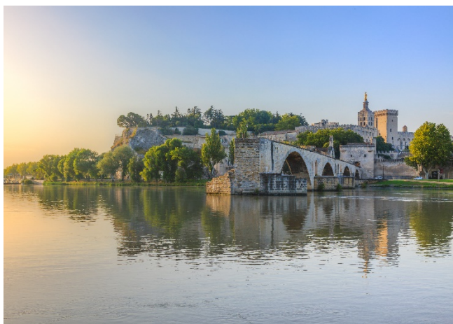
Saint-Bénézet Avignon

Am Abend erreichen Sie Marseille. Gemeinsames Abschlussabendessen am alten Hafen Vieux-Port. 1 Übernachtung in Marseille.