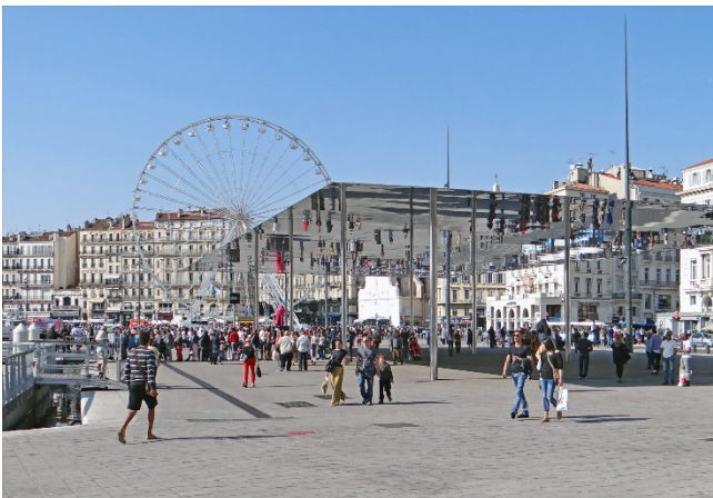
Le quai des Belges

Heute widmen Sie sich bei Tageslicht dem Vieux-Port , der seit 2600 Jahren der Kern der Stadt ist und heute teilweise zur Fußgängerzone umgestaltet wurde. Ein schillernder Pavillon, erstreckt sich mit 46 m Länge und 22 m Breite an der Hafenmeile. Auf dem Hafenkai „Quai des Belges“ im Alten Hafen findet jeden Morgen Fischmarkt statt – genau der richtige Ort, um die Hafenuft und -atmosphäre einzusatmen und den Tag mit einem zweiten Frühstückssnack (fakultativ) zu beginnen.