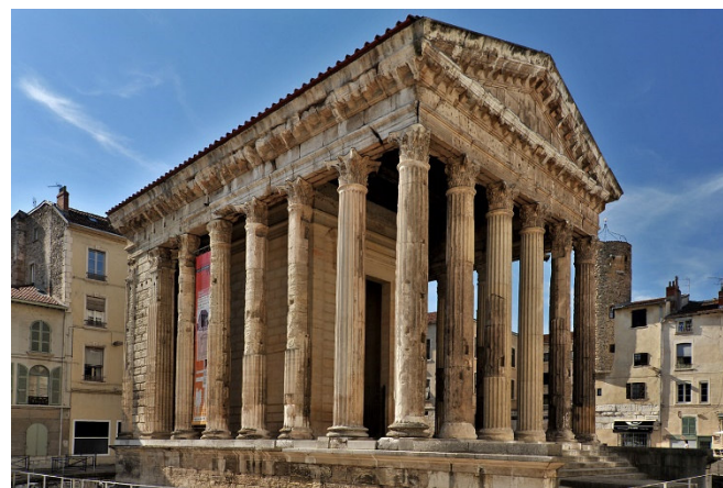
Vienne Tempel des Augustus und der Livia

Etwa 15 km weiter erreichen Sie Vienne. Die Stadt wartet mit ihren zahlreichen römischen Baudenkmalern auf. Bei einem Stadtrundgang besuchen Sie die Kathedrale Saint-Maurice , die ehemalige Kathedrale des Erzbistums. Auf der Place du Palais sehen Sie den Tempel des Augustus und der Livia , ein harmonisches Bauwerk aus dem 1. Jh., das durch Restaurierungen im 19. Jh. sein ursprüngliches Erscheinungsbild wiedererhielt.