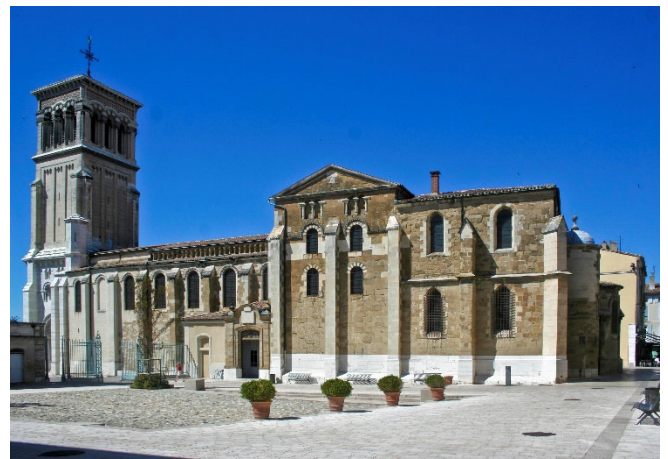
Valence - St. Apollinaire

Für Unermüdliche (fakultativ): Valence wird gerne auch als Kanal- und Gartenstadt bezeichnet. Ein kilometerlanges Netz aus unterirdischen Kanälen erstreckt sich im Stadtgebiet. Bei einer 17 km langen lohnenswerten Fahrt entlang des Canal du Thon und des Canal de la Grande Marquise eröffnet sich Ihnen das oberirdische Gewässernetz der Kanäle.