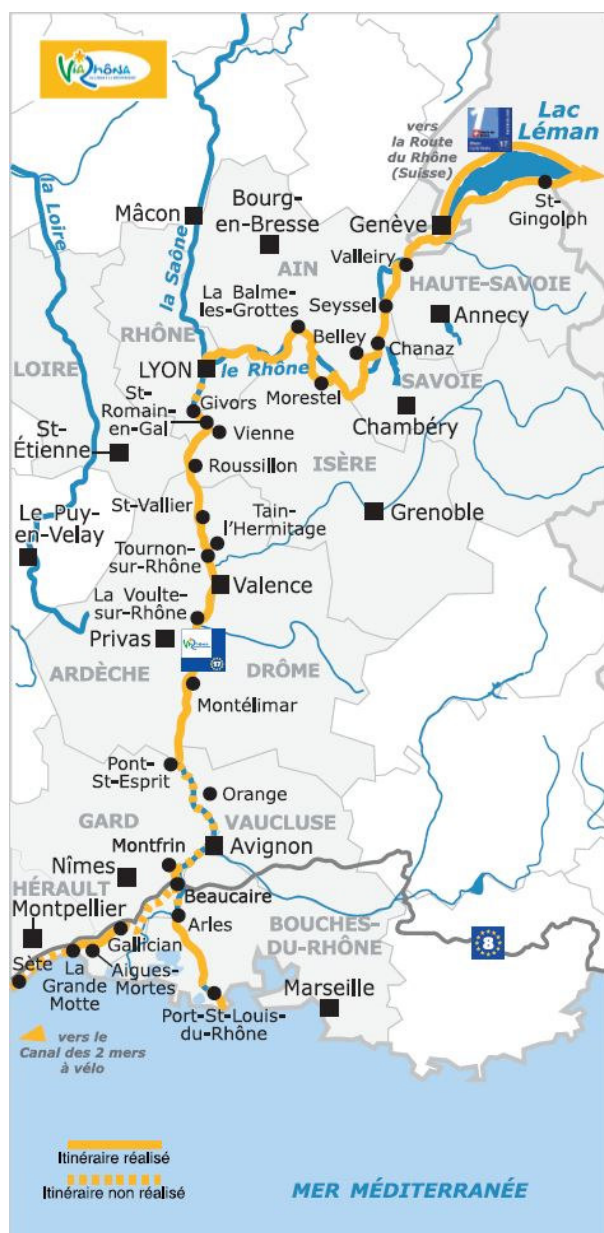
Streckenverlauf ViaRhôna

Entlang berühmter Weinberge, idyllischer Orte und kleiner Städte mit römischen und mittelalterlichen Kulturschätzen radeln Sie von der gastronomischen Hauptstadt Lyon über die Kanal- und Gartenstadt Valence bis in das malerische Städtchen Bourg-Saint-Andéol.