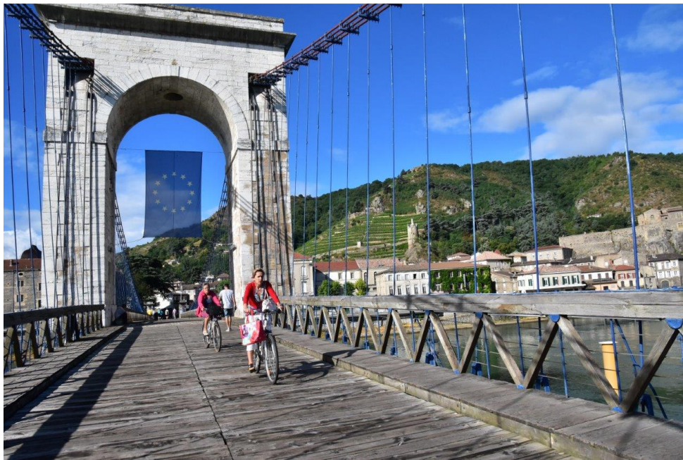
ViaRhôna – Tournon

Kultur aktiv erleben und mit Muße genießen – das können Sie auf unserer Studienreise mit Radtouren. An den Ufern der Rhone erwartet Sie eine Symphonie aus herrlichen Landschaften, kulturbeladenen Städten, charakteristischen Dörfern und kulinarischen Erlebnissen. Sie beginnen Ihre Reise entlang der ViaRhôna im malerischen Lyon , wo Sie Ihre E-Bikes für die nächsten Reisetage satteln. In Begleitung eines Reisebusses entdecken Sie die kulturellen und historischen Schätze der Region und radeln entlang der Obstplantagen und Weinberge durch das Rhône-Tal. Während und im Anschluss an die jeweils 2 – 4 stündigen Touren entdecken Sie die mit römi-schen Baudenkmalern geprägten Städte Vienne und Valence sowie die wunderschönen, histori-schen Ortskerne kleinerer Dörfer entlang des Weges.