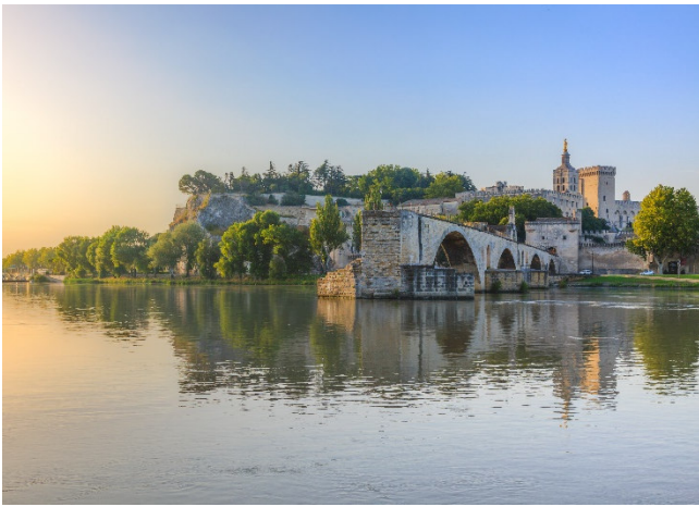
Saint-Bénézet Avignon CCBYSA Chiugoran-at-commons.wikimedia

Am Abend erreichen Sie Marseille. Gemeinsames Abschlussabendessen am alten Hafen Vieux-Port. 1 Übernachtung in Marseille.