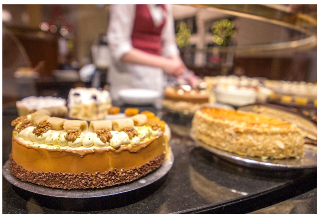
Café Niederegger

Fahrt im modernen Fernreisebus von Köln nach Lübeck (Vorübernachtung in Köln auf Anfrage). Nach der Ankunft in Lübeck und dem Zimmerbezug für die nächsten 3 Übernachtungen, machen Sie sich auf zu einem ersten Stadtspaziergang durch die Altstadt. Im Anschluss besuchen Sie die Marzipanerie und den Salon im Café Niederegger . Zum Vernaschen sind die hier gezauberten Marzipankunstwerke eigentlich viel zu schade! Schauen Sie den Spezialisten beim Modellieren über die Schulter, bewundern Sie die lebensgroßen Marzipan-Figuren und lassen Sie sich von süßen Niederegger-Spezialitäten verführen. Gemeinsames Abendessen im Hotel.