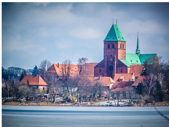
Ratzeburger Dom

Zum Abschluss Ihrer Reise dürfen Sie sich auf ein schönes gemeinsames Abendessen in den historischen Hallen der Schiffergesellschaft freuen.