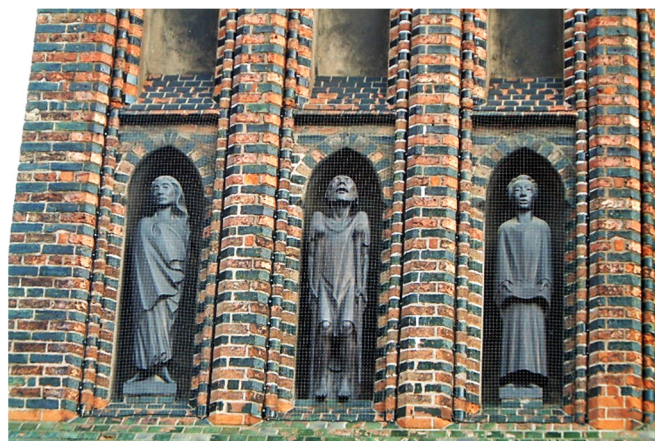
Katharineum mit Skulpturen Ernst Barlachs

Sie besuchen den Dom zu Lübeck , den ersten großen Backsteinkirchbau an der Ostsee sowie die Bürger- und Marktkirche St. Marien und das bedeutsame Heilig-Geist-Spital (Außenbesichtigung). Danach bleibt Zeit für eine individuelle Mittagspause. Am frühen Nachmittag besuchen Sie das Buddenbrookhaus – ganz dem Thema „ Weihnachten mit den Buddenbrooks “ gewidmet. Während Sie sich im festlichen Ambiente bei Kaffee und Kuchen stärken, lauschen Sie einer Lesung. Im Anschluss besichtigen Sie das Haus und wandeln dann auf den Spuren der Familie Mann durch Lübecks Altstadt. Gemeinsames Abendessen im Restaurant Schabbelhaus.