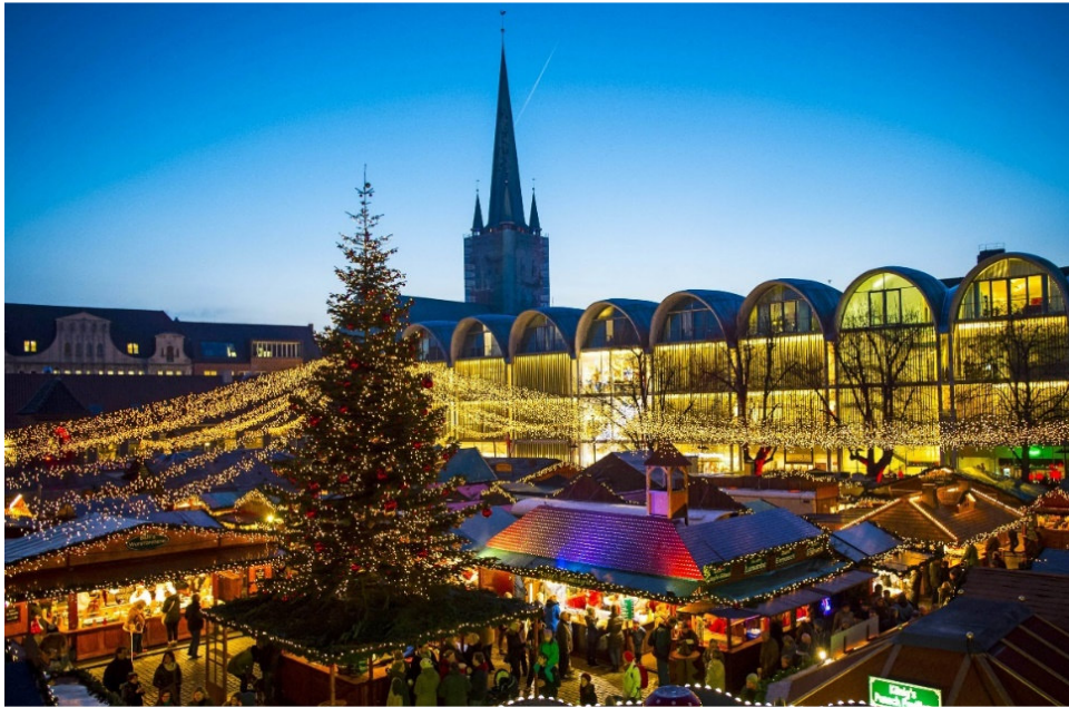
Lübecker Weihnachtsmarkt

Wandeln Sie auf den Spuren gleich dreier Nobelpreisträger durch das vorweihnachtliche Lübeck: Sowohl Thomas Mann (Literaturnobelpreisträger 1929, in Lübeck geboren) als auch Willy Brandt (Friedensnobelpreisträger 1971), der seine prägenden Jugendjahre hier verlebte, und Günter Grass (Literaturnobelpreisträger 1999), der erst als fast 70-Jähriger nach Lübeck zog, betrachteten die Stadt an der Trave als ihre Heimat.