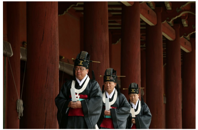
Seoul Jongmyo Schrein CCBYSA4.0-KOREA.NET-at-flickr

Bei einer Besichtigung des Jongmyo-Schreins tauchen Sie tief in die koreanische Kultur ein. Bis heute werden hier Gedenkrituale für die verstorbenen Könige durchgeführt.