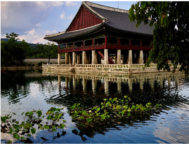
Seoul Gyeongbokgung Palast

Mittags Ankunft in Seoul, der Hauptstadt Südkoreas. Schon der Flughafen Incheon und die Fahrt ins Zentrum vermitteln einen ersten Eindruck von der riesigen supermodernen Boom-Metropole. Zimmerbezug für die nächsten 4 Übernachtungen. Lassen Sie sich von dem Gyeongbokgung-Palast beeindrucken, der mit seinen wunderschönen Gärten und eleganten Innenhöfen der weitläufigste und prächtigste der fünf erhaltenen Paläste ist. Während der Joseon Dynastie (1392–1910) war dieser der zentrale Königspalast. Bei einem Besuch des Folklore Museums begegnen Ihnen koreanische Kultur und Lebensstil der alten und neuen Zeit.