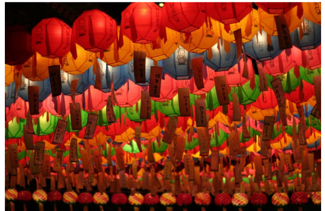
Seoul Yogyesa Laternenparade

Lassen Sie sich abends von der Freude der Menschen anstecken, die Buddhas Geburtstag feiern. Ganz Seoul ist auf den Beinen, und die Stadt präsentiert sich als einzigartiges Lichtermeer.