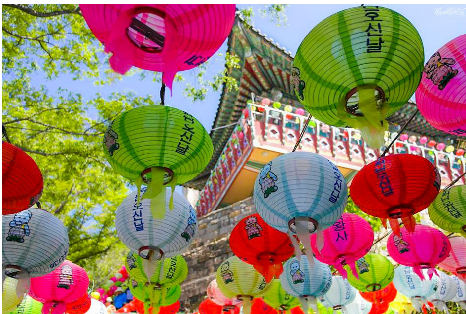
Buddhas Geburtstag

Reisetermin: 10.05. – 21.05.2019 Verlängerungsmöglichkeit bis 23.05.2019