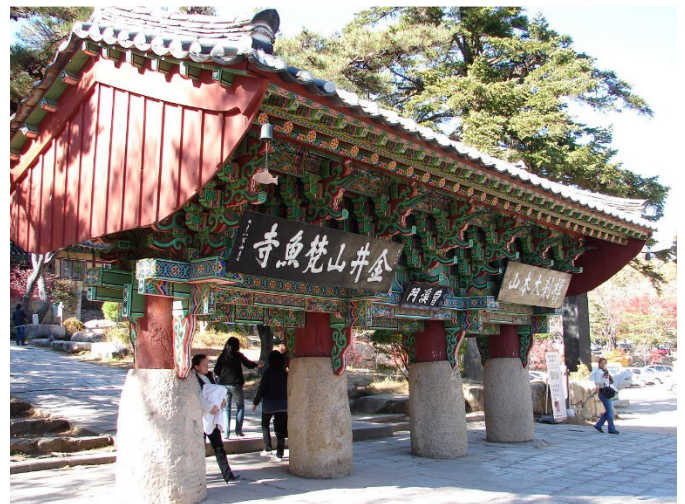
Busan Beomeosa_CCBYSA 3.0-Steve46814-at-wikipedia commons

Auf halbem Weg nach Busan, der zweitgrößten Stadt Koreas, machen Sie Halt beim zauberhaften Tongdosa-Tempel , ebenfalls ein „Tempel der Drei Juwelen“. Berühmt sind vor allem seine vielen Statuen und eine beachtliche Kunstsammlung. Die Anlage aus dem Jahr 647 ist die größte im Land. Entlang einer herrlichen Kiefernallee befinden sich die durch Steinstelen gekennzeichneten Begräbnisstätten bedeutender Mönche. Als heiligste Schätze werden eine aus China stammende Schriftrolle und eine Reliquie verehrt.