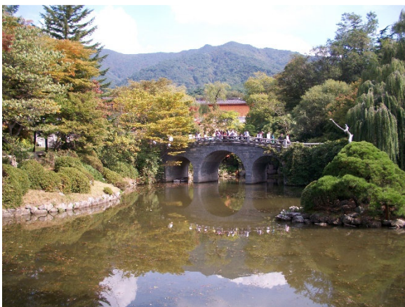
Gyeongju Bulguksa-Tempel

8. Tag Hauptstadt des alten Königreichs Silla Heute besuchen Sie den Bulguksa-Tempel (UNESCO-Weltkulturerbe), eine der ältesten buddhistischen Klosteranlagen. Er wird als Meisterwerk der Blütezeit der buddhistischen Kunst angesehen und birgt sieben Nationalschätze.