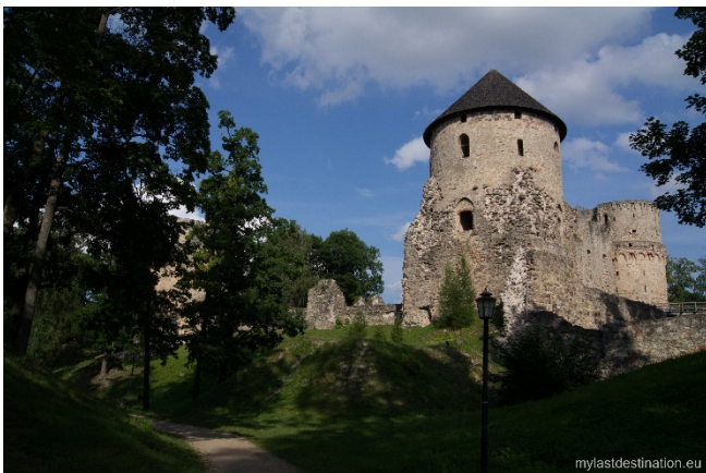
Burg und Park Cesis

Cesis (Wenden) rühmt sich, eine der schönsten mittelalterlichen Städte Lettlands zu sein. In der Altstadt finden sich ganze Straßenzüge mit Holzhäusern. Ab 1237 war sie zunächst die Zentrale des Schwertbrüderordens, nach dessen Auflösung wichtige Niederlassung des Deutschen Ordens bis 1561. Besichtigung der gut erhaltenen Burgruine .