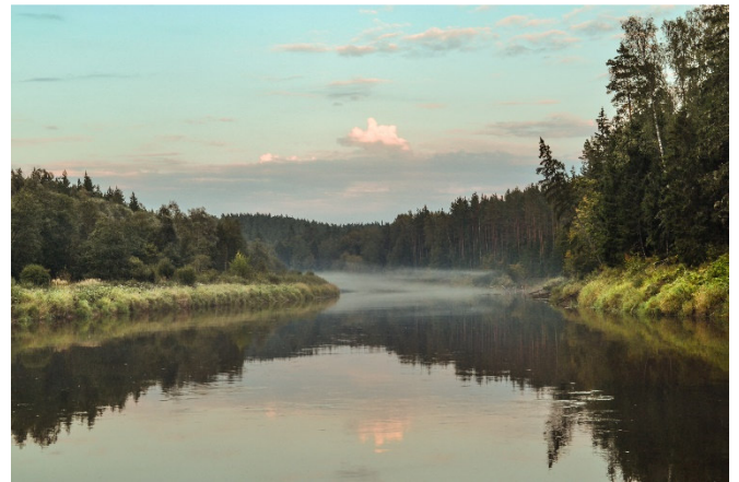
Gauja Nationalpark