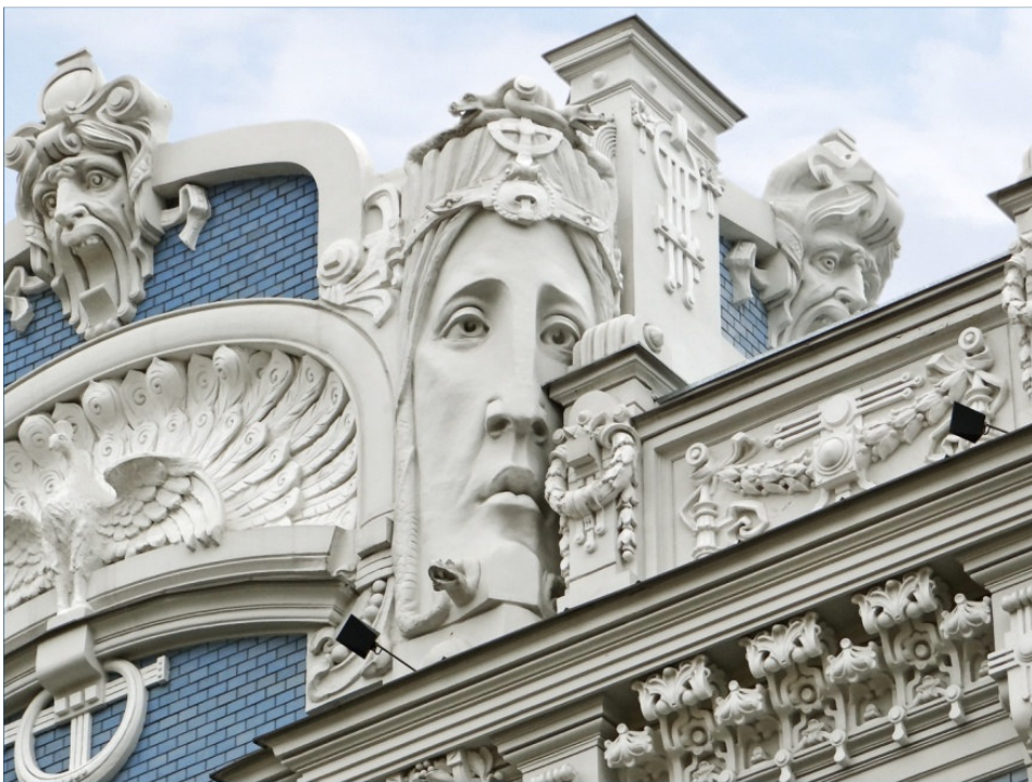
Riga - Jugendstilhaus

Die Reise führt uns nach Lettland, womit wir unsere Erkundung der Baltischen Länder zum Abschluss bringen. Wir starten und beenden unsere Reise in Riga , berühmt für ihren Jugendstil und Kulturhauptstadt Europas 2014. Riga, als „heimliche Hauptstadt des Baltikums“ bietet zahlreiche sehenswürdige Aspekte, die einen intensiveren Aufenthalt dort lohnen. In einer mehrtägigen Rundfahrt lernen wir die vier wichtigsten Kulturlandschaften Lettlands und die Zeugnisse der alten Geschichte dieses Landes kennen: Im Westen Kurland und die Ostseeküste , in Lettgallen prächtige Barockschlösser, in Semgallen das lettische „Kernland“, eher bäuerlich ländlich geprägt, und schließlich im Norden idyllische Nationalparks, Burgen und mittelalterliche Städtchen.