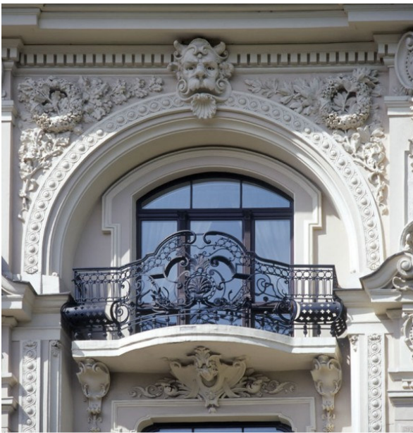
Riga - Fenster

An diesem Tag erkunden wir Riga: Eine Exkursion in acht Jahrhunderte Geschichte, begleitet von wunderschönen Fotomotiven, wird genießbar durch kleine Pausen zwischendurch, bei denen wir die moderne lettische Hauptstadt mit ihrem vielfältigen kulinarischen Angebot kennenlernen.