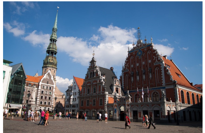
Riga Rathausplatz

Am Nachmittag geht es über den Boulevardring in die Neustadt mit dem Jugendstilviertel am Kronvaldspark und in die großzügig und grün angelegten Neubauviertel rund um die mittelalterliche Altstadt.