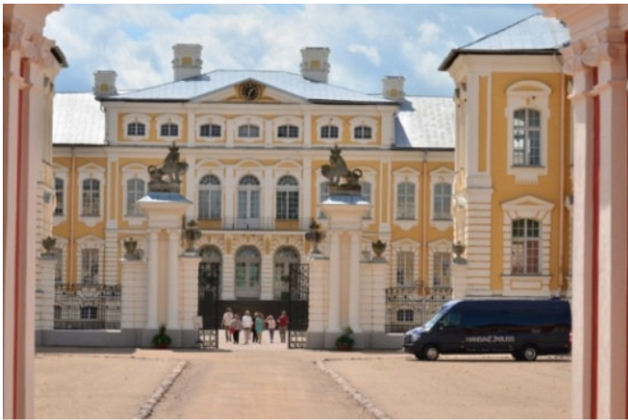
Schloss Rundale

Rundale , auch „Versailles des Baltikums“ genannt, gilt als eines der bedeutendsten Denkmäler des Barock und Rokoko im Baltikum. Besichtigung des Schlosses und des Schlossparks im französischen Stil.