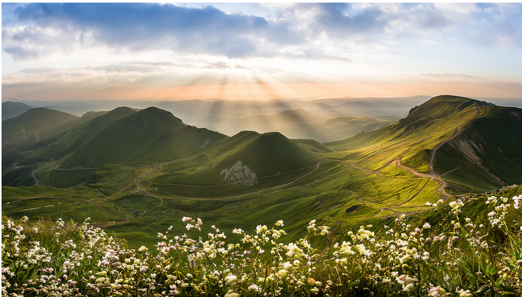
Puy de Dome - Panoramaaussicht

„Am Anfang schuf Gott die Auvergne. Und dann lange Zeit nichts, nichts, nichts. Und dann den Rest der Welt“ (Henri Pourrat, 1959).