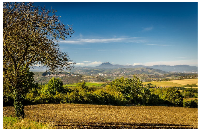
Puy Mont Domes

Auffahrt mit der Zahnradbahn zum Puy de Dôme , dem höchsten Kegelvulkan des Massivs. Der leise und umweltfreundliche „Panoramiques des Dômes“ ermöglicht einen sicheren Zugang zum Gipfel und bietet seinen Besuchern ein einzigartiges Rundumpanorama über die Vulkangipfel des ganzen Departements ( wetterabhängig ).