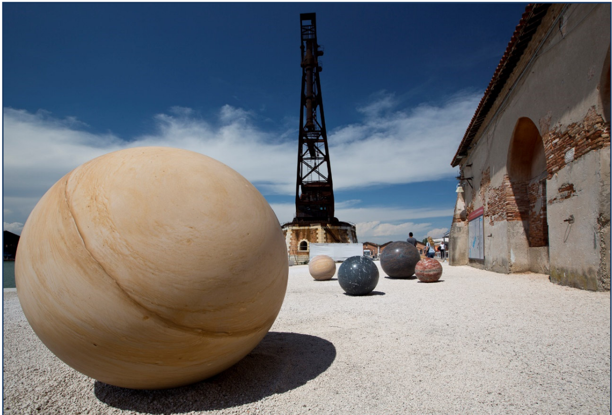
Venedig Biennale 2017