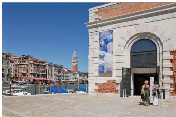
Venedig Punta della Dogana

Dieser Tag steht wieder ganz im Zeichen der Kunst. Mit dem Vaporetto fahren Sie zur Biennale und besuchen die einzigartigen Ausstellungshallen des Arsenale . Unter fachkundiger Führung geht es durch dieses spannende Kunstgelände.