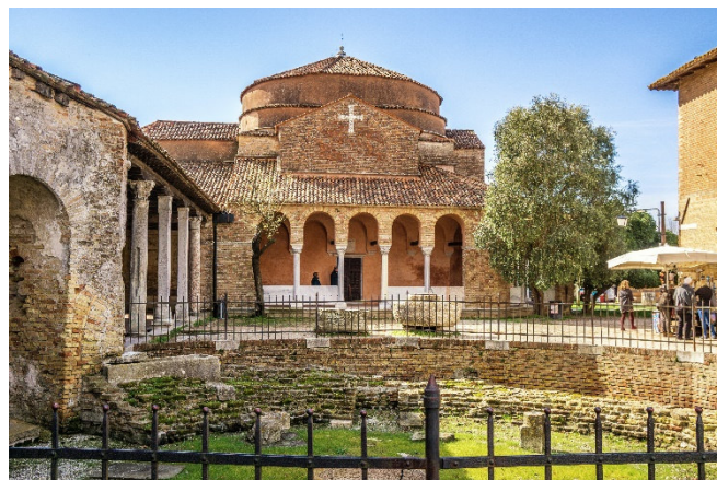
Torcello Santa Fosca

Gemeinsames Abendessen in einer venezianischen Trattoria.