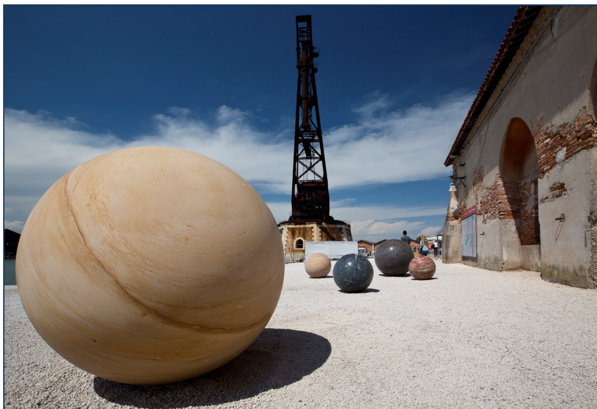
Venedig Biennale 2017