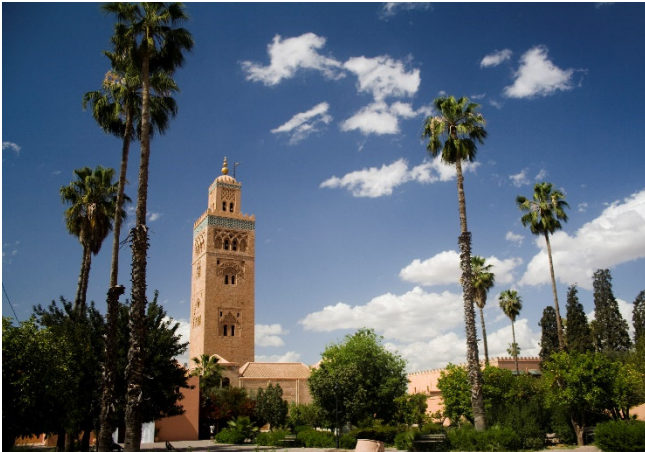
Koutoubia Moschee

Nach dem Frühstück setzten Sie die Besichtigung der pulsierenden Metropole fort. Die viertgrößte Stadt des Landes liegt, umgeben von Palmenhainen, auf 450 m Höhe in der fruchtbaren Haouz-Ebene.