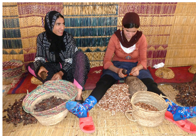
Arganöl Kooperative

Auf dem Weg zwischen Marrakesch und dem Meer gibt es eine einzigartige biologische Besonderheit: den Arganbaum. Er wächst weltweit nur noch in Südmarokko. Sie machen Halt an einer Arganöl-Kooperative und lernen die Einzelheiten der aufwendigen, traditionellen Arganöl-Gewinnung kennen. Das Öl ist nicht nur medizinisch und kosmetisch äußerst wertvoll, sondern auch zum Kochen und Würzen ein kulinarischer Genuss. Erleben Sie den einzigartig nussigen Geschmack bei einer Verkostung .