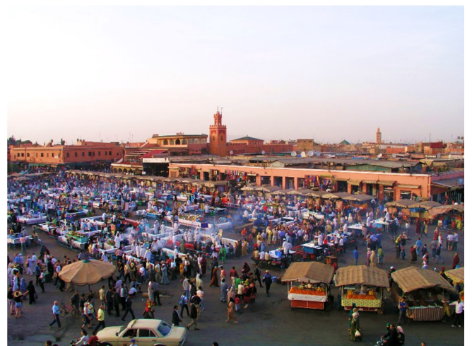
Djemaa el Fna

Nach der Besichtigung geht es zurück in den Trubel der Stadt: Gemeinsamer Abendimbiss auf dem Djemaa el Fna .