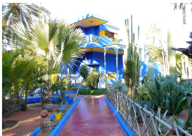
Jardin Majorelle

Heute erreichen Sie zunächst den Jardin Majorelle mit seinem Museum. Inspiriert von den marokkanischen Palästen und Häusern mit ihren erfrischenden Gärten und Wasserspielen, plante der französische Maler Jacques Majorelle sein Haus mit Atelier und Garten für den er Pflanzen aus der ganzen Welt und aus verschiedenen Klimazonen sammelte. Angepflanzt wurden Palmen aus Kalifornien, Ostafrika, Indien, von den Kanarischen Inseln sowie aus dem Mittelmeer und dem arabischen Raum. Verschiedene Bambuspflanzen, blühende Topfpflanzen und dekorative Wasserpflanzen setzen Akzente in dieser grünen Oase. Bereits 1947 machte Majorelle seinen Garten der Öffentlichkeit zugänglich. Die Fassaden des Ateliers und andere Flächen sind in einem besonders schönen Kobaltblau gestrichen, das heute noch als „Majorelle-Blau“ bezeichnet wird. Nach dem Tod des Malers verwilderte und verwahrloste sein botanischer Garten im Laufe der Jahre jedoch zusehends und geriet mehr und mehr in Vergessenheit. 1980 kaufte der Modeschöpfer Yves Saint-Laurent das Haus mit Garten und verwandelte ihn wieder in ein botanisches Juwel.