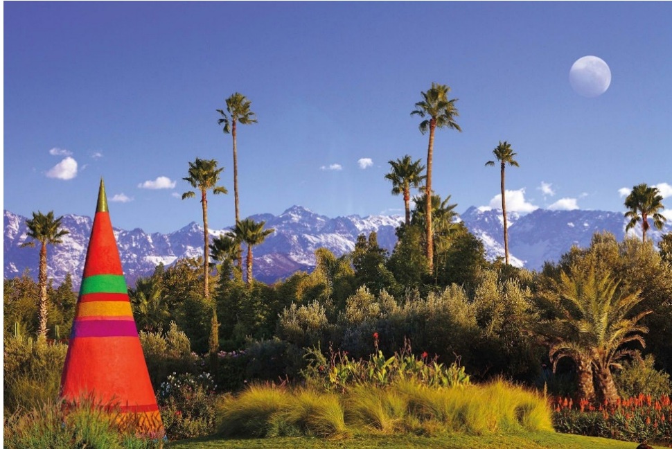
Garten André Heller

Marrakesch ist viel mehr als eine Oase , eine echte Gartenstadt. Hier entfalten sich Grünflächen, die von der Anziehungskraft der Marrakchis für die Kunst der Gärten zeugt.