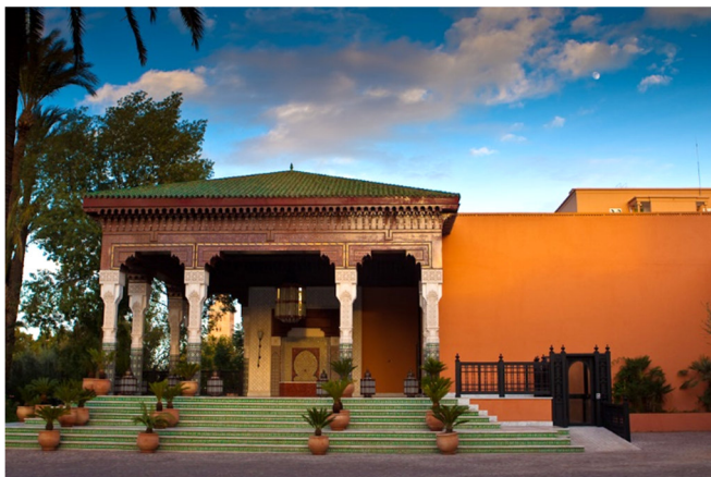
La Mamounia

Zum Abschluss Ihrer Reise besuchen Sie noch einen letzten bezaubernden Garten, der nicht unbeachtet bleiben darf. Die prächtige Anlage versteckt sich hinter den Mauern des Hotels La Mamounia welches 1922/1923 erbaut und Ende 2009 nach aufwendigen Renovierungsarbeiten wiedereröffnet wurde. Die Stilkone in Sachen Luxushotels, begeistert mit Werken der talentiertesten Maler und Holzschnitzkünstler der Stadt, Säulen mit kunstvollen Verzierungen und mit hunderten handgeschmiedeter Laternen. Von Beginn an kamen namhafte Besucher – Winston Churchill verbrachte hier viele Winter, malte die Landschaft und schrieb Teile seiner Memoiren – und auch heute noch steigen hier gerne Filmstars und Adlige ab.