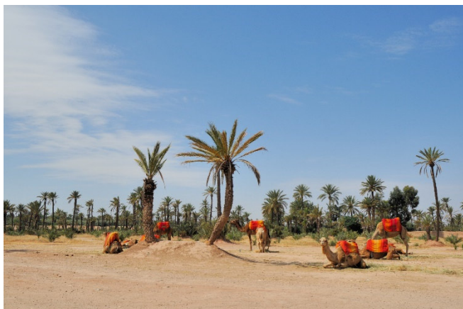
La Palmeraie de Marrakech

Nach dem Frühstück brechen Sie auf zu einer kleinen Rundfahrt in Richtung der Palmerai , im Norden von Marrakesch. Der Palmenhain umfasst mehr als 100.000 Bäume auf einer Fläche von über 13.000 ha. Seine Geschichte begann im 12. Jh. als die Almoraviden in Marrakesch herrschten und hier eine kleine Stadt von 300 ha und einen riesigen Garten von 555 ha anlegten – Gärten waren also schon immer sehr wichtig für die Stadt Marrakesch. Zu dieser Zeit wurden einige Palmenarten als Symbol für Leben und Fruchtbarkeit verehrt. Die angelegten Kulturen waren zahlreich und die hohe Baumdichte erlaubt es, sich gegen die Hitze zu schützen.