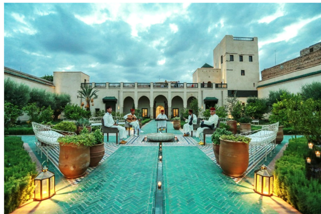
Le Jardin Secret

chen arabisch-andalusischen und marokkanischen Paläste und beherbergt herausragende Beispiele islamischer Kunst und Architektur.