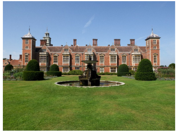
Blickling Estate

Weiterfahrt nach Norwich und Hotelbezug für 2 Übernachtungen.