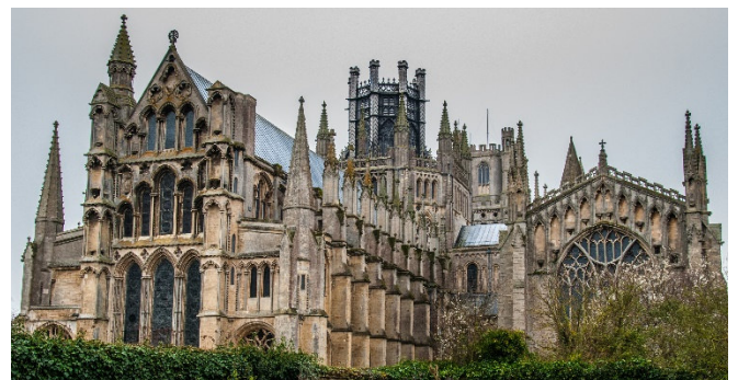
Ely Cathedral

Bei einem Stadtrundgang erkunden Sie nun die seit 1000 Jahren wichtigste ostenglische Stadt, und kommen vorbei an der imposanten Burg (Außenbesichtigung), die 700 Jahre lang als Gefängnis diente. Bei einer Besichtigung der anglikanischen Kathedrale gehen Sie durch das Besucherzentrum, das sich in der Tradition der Gastfreundschaft und Gelehrsamkeit der Benediktinermönche versteht. Besonders reizvoll ist der Kreuzgang mit fast 400 farbigen Schlusssteinen , die u. a. Szenen der Passionsgeschichte darstellen. Lauschen Sie dem Evensong , der Abendandacht der anglikanischen Kirche, mit einer beeindruckenden, von Musik und Gesang getragenen Liturgie.