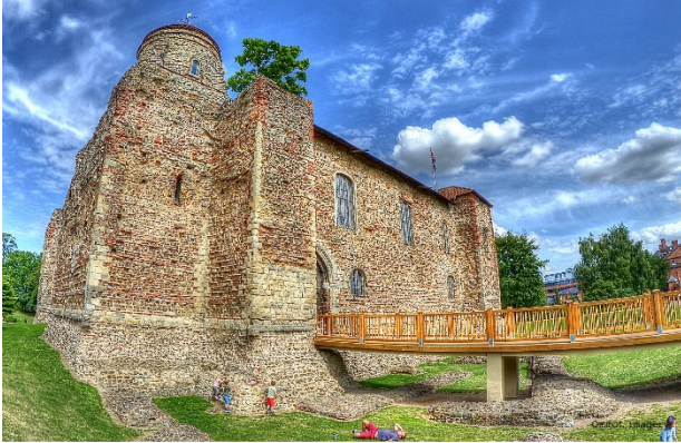
Colchester Castle

Fahrt im komfortablen Fernreisebus von Köln nach Hoek van Holland (Vorübernachtung auf Anfrage). Fährrüberfahrt nach Harwich. Das Abendessen nehmen Sie bereits an Bord der Fähre ein. Weiterfahrt mit dem Bus nach Colchester. 1 Übernachtung in einem schön gelegenen Resorthotel.