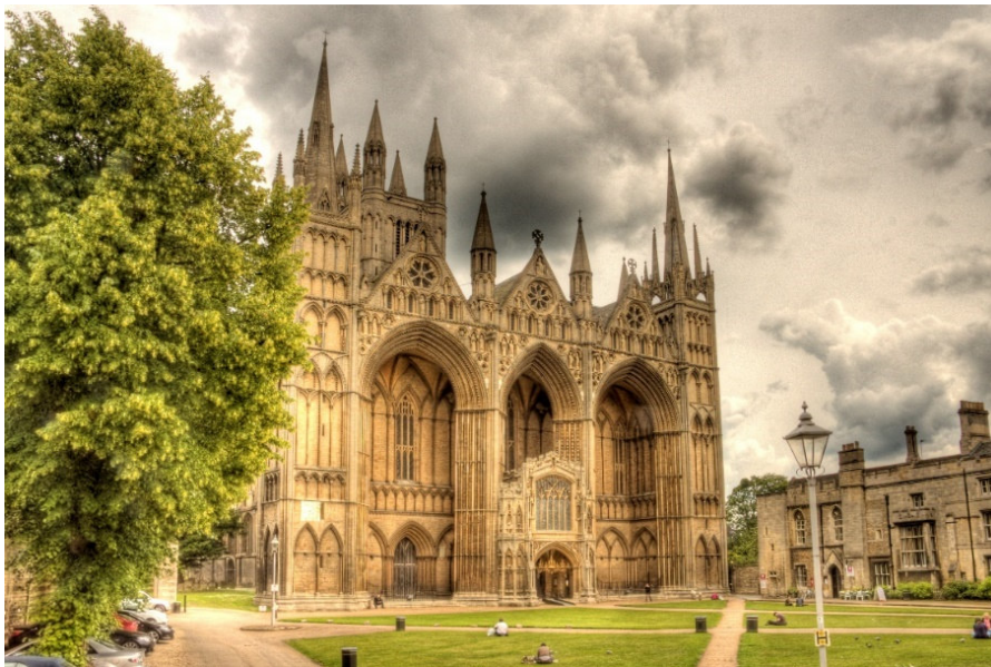
Peterborough Cathedral

Erleben Sie faszinierende Meisterwerke englischer Kathedralbaukunst aus über 1000 Jahren im bezaubernden Osten Englands! Durch den kurzen Seeweg zum Kontinent blühten die Handelsbeziehungen, es siedelten sich viele Einwanderer hier an, und es entstanden kleine und größere Städte, die u. a. durch ihre Kathedralen glänzen.