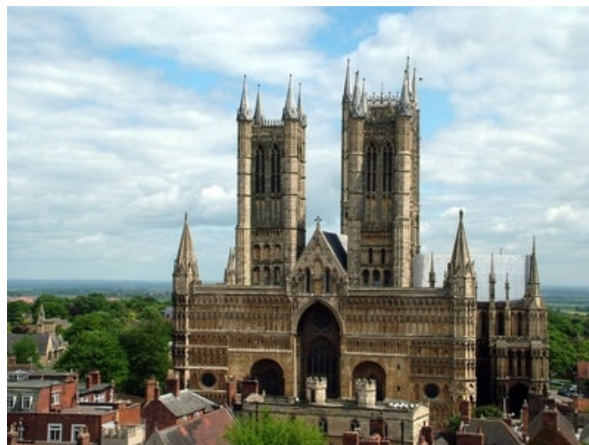
Lincoln Kathedrale

Die Stadt Lincoln geht auf das römische „Lindum Colonia“ zurück, wovon das Nordtor noch heute zeugt. Mittelalterliche Gassen aus Kopfsteinpflaster führen hinauf zur Kathedrale, während der untere, moderne Teil der Stadt mit schönen Einkaufsvierteln und der attraktiven Brayford Marina am Ufer des Flusses Witham besticht. Hier befindet sich auch Ihr Hotel für die letzte Übernachtung in England.