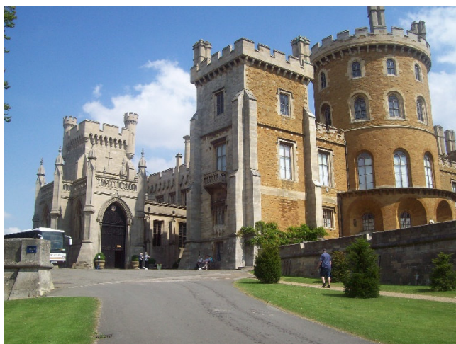
Belvoir Castle