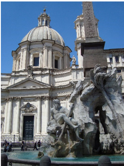
Rom Piazza Navona

Gemeinsam besichtigen Sie nun in der Altstadt die Piazza Navona , einen der schönsten Plätze Roms. Der Vierströme-Brunnen in der Platzmitte, ein Werk Berninis, stellt die zur damaligen Zeit bekannten vier Erdteile dar.