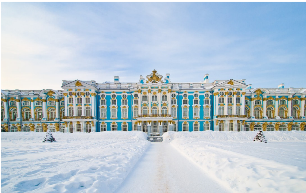
Puschkin Palast

St. Petersburg, bekannt als „ Venedig des Nordens “, gehört zu den schönsten Städten Europas. Breite Boulevards, prachtvolle Gebäude , großzügig angelegte Plätze und stille Kanäle mit kunstvollen Brücken zeugen noch heute von der ruhmreichen Vergangenheit der Residenzstadt der Zaren . Hochklassige Museen - darunter die weltberühmte Eremitage , prunkvolle Schlösser und erstklassige Aufführungen in den vielen Theatern und Festspielhäusern der Stadt lassen einen Besuch der nördlichsten Metropole der Welt zu einem unvergesslichen Erlebnis werden.