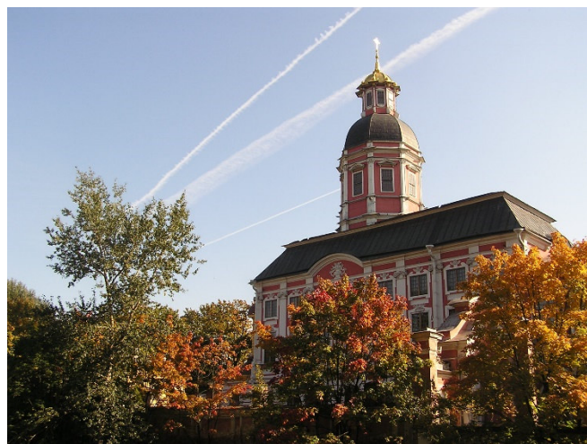
Alexander-Newski-Kloster

Am Nachmittag legen Sie einen Stopp am Alexander-Newski-Kloster ein. Kloster wurde in den Jahren 1710–1716 zu Ehren des Großfürsten Wladimir Alexander Newskij (1218–1253) nach den Plänen von D.P. Tresini erbaut. Zu dem Gebäudekomplex gehören elf Kirchen und vier Friedhöfe, die von großem historischen Interesse sind. Hier ruhen viele berühmte Künstler, Wissenschaftler, Architekten, Schriftsteller und Komponisten wie z.B. Lomonossow, Rossi, Dostojewski, Tschaikowskij, Mussorgskij, Glinka, Rimskij-Korsakow. Es ist nach dem Kloster von Kiew und Sergijew-Possad das größte Kloster Russlands.