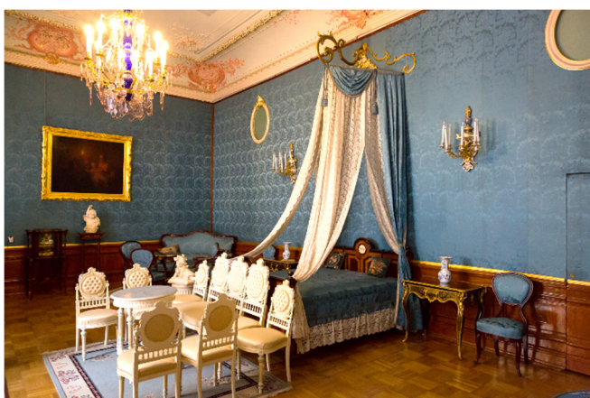
Jussupow Palais

Anschließend erreichen Sie den Jussupow Palais auch Moika-Palast genannt. Benannt ist der Wohnpalast mit seiner schönen Lage am Moika-Ufer nach seinen langjährigen Bewohnern. Bei einer Führung erfahren Sie mehr über den weitreichenden Stammbaum, der wohlhabenden russischen Adelsfamilie, der bis in das russische Mittelalter zurückreicht. Die Innenausstattung des Palais ist überaus luxuriös; die Architektur üpzig. Es gibt 120 Zimmer, 18 große Säle sowie ein mit 200 Plätzen ausgestattetes Theater.