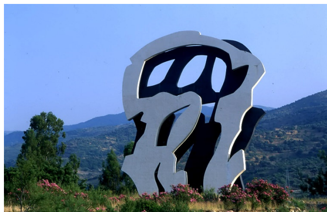
La materia poteva non esserci (C) Pietro Consagra

1 Übernachtung in einem Hotel am Meer bei Agrigent.