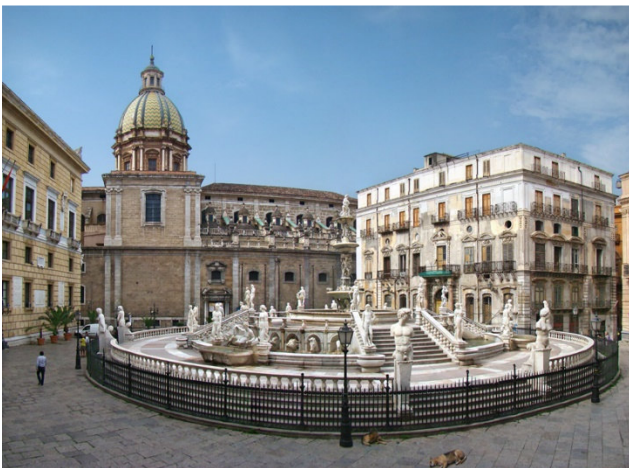
Palermo Piazza Pretoria

Flug mit Lufthansa von Frankfurt nach Palermo (Zubringerflüge auf Anfrage). Zimmerbezug für die nächsten 3 Nächte im zentral gelegenen 4-Sterne-Hotel. Gemeinsames Abendessen in einer Trattoria.