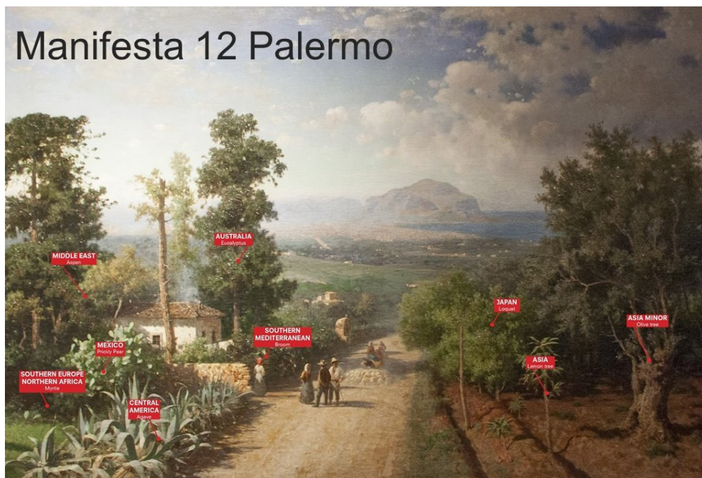
Veduta di Palermo, Francesco Lojacono (C) Manifesta 12 Courtesy OMA

Erleben Sie bei dieser Reise eine spannende Kombination historischer Kultur mit moderner und zeitgenössischer Kunst . Palermo wurde als Austragungsort der Manifesta 12 ausgewählt. Nicht ohne Grund! Die Stadt selbst mit ihrer reichen Geschichte und ihren unterschiedlichen Lebensentwürfen steht im Mittelpunkt der Ausstellungen. Sie werden bei Ihren Erkundungen nicht nur bekannte, geschichtsträchtige Orte besuchen, sondern auch verborgene, Straßen und Plätze kennen lernen, die das Lebensgefühl in dieser Metropole widerspiegeln.