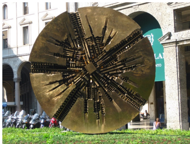
Gibellina CCBYSA2.0 greenmarlin-at-flickr

Das alte, verlassene Gibellina (Gibellina Vecchia) wurde, unter einer großen Betonschicht begraben, zu einem Monument der Erinnerung in einer stillen Landschaft.